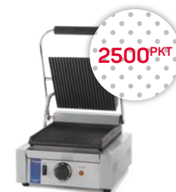
Grill kontaktowy do panini