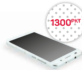
Smartfon z aparatem min. 5Mpx