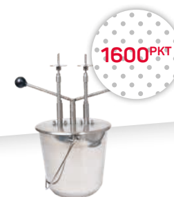
Nadzewarka do pączków dwuigłowa z wiadrem