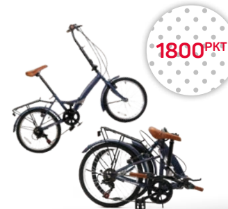
Składany rower miejski, z przerzutkami